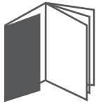
Gate-Folder, nach innen geklappter Umschlag € 4.990

zzgl. techn. Sonderkosten in Höhe von € 2370